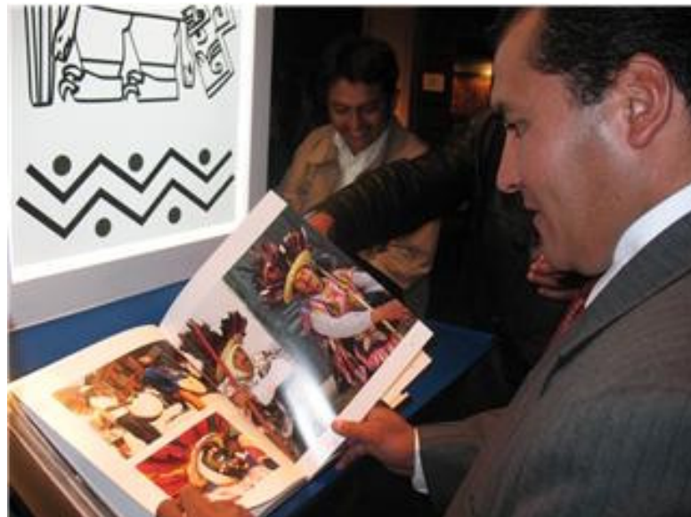
Autoridades nacionales y regionales asistieron a la presentación del libro