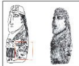
Viñeta de Samuel Paredes Romero

Más de 200 imágenes de artistas prehispánicos útiles para los creadores contemporáneos.